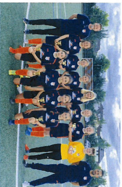
Bei einem Jugendturnier des FV Eppertshausen erreichten die FSV C-Juniorinnen einen guten 8. Platz.

Sonnenwendfeier in Eppertshausen: Am Freitag 24. Juni, findet nach langer Zeit wieder eine Fester zur Sommeranwendung am Fallschneise in Eppertshausen statt. Man will mit einer kurzen offiziellen Wanderung die Wanderfreunde von OWK Eppertshausen besuchen. Start um 19 Uhr am Wanderheim. Eine Anmeldung ist nicht erforderlich.