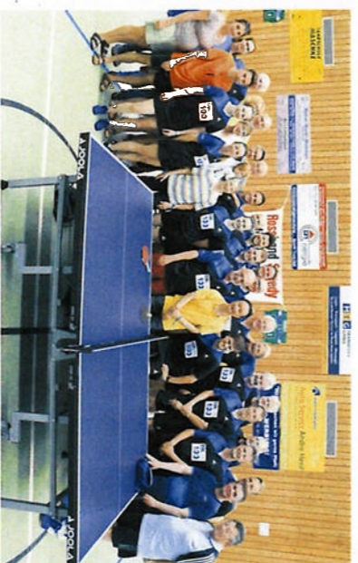
Die Teilnehmer des Revival-Turniers ehemaliger aktiver Tischtennis-Spieler der DJK.